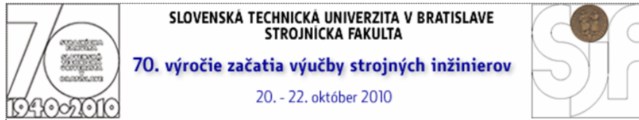
Banner osláv 70. výročia začatia výučby strojných inžinierov na STU na stránke Sjf STU