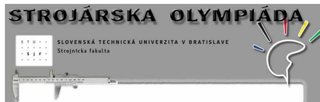
Časť web stránky Strojárska olympiáda z roku 2010

V rámci programu olympiády bude potrebné zvážiť aj návštevu laboratórií. Laboratória v „ťažkom pavilóne“ by mali byť rekonštruované. Vynovené priestory by tak tiež mohli napomôcť pri rozhodovaní o štúdiu stredoškólkov.