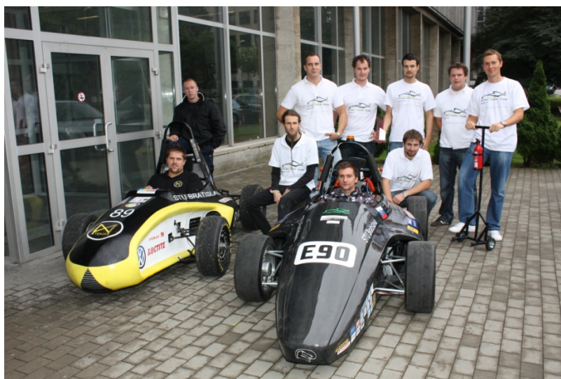
Študentské formuly AM Team a STUBA Green Team vystavované na Letnej univerzite stredoškólkov.

Dekan fakulty informoval o úspechoch obidvoch tímov našich formúl. Úspechy svedčia o vysokej odbornej zdatnosti našich študentov, ktorí sa môžu porovnávať so študentmi zahraničných univerzít.