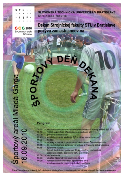
Informačný plagát „Športový deň dekana 2010“.